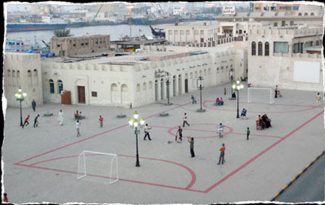
Photo par Maider Lopez ( http://cca-actions.org/fr/actions/sortir-un-terrain-de-football-d%E2%80%99un-pot-de-peinture )